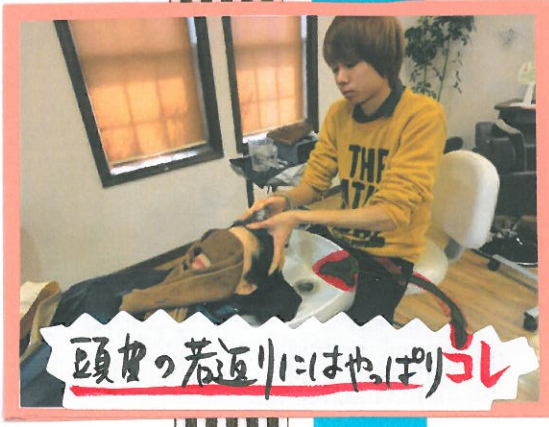
頭皮の若返りにはやはりトリコ!

ほとんどの方が はじ頭の痕から開放 されて、もう ぐっすりです!! 20分コース 4000円〜